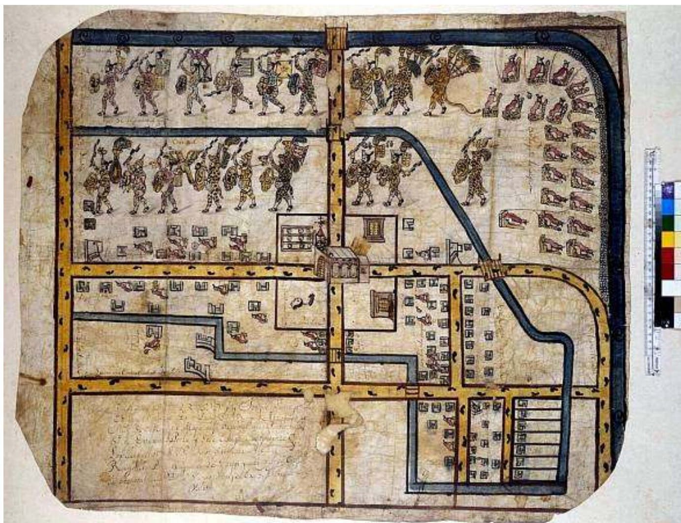
Mapa z Codexu Mexicanus.